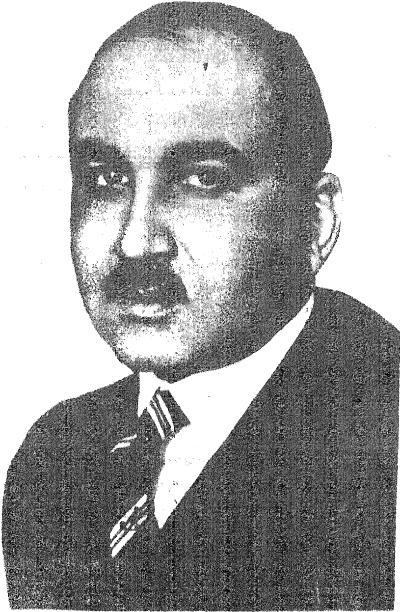
الأمير زيد ابن الحسين